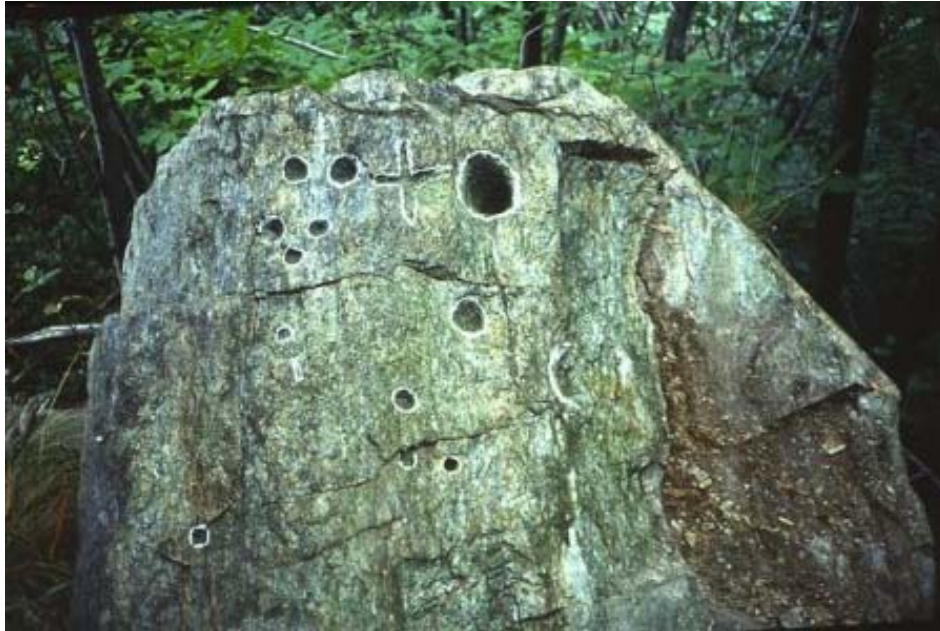
Fig. 4- Intragna - Pressi di Alpe Pechì

finale, ma nessuno ci levrebbe il dubbio che ad eseguirle sia stato un turista degli anni 1960. Il paradosso serve a ricordare che l'atteggiamento culturale di incidere coppelle dura probabilmente da diverse decine di migliaia di anni sopravvivendo, come alcune osservazioni sembrano indicare, ancor oggi, anche se dalla mente dell'incisore recente è scomparsa la cultura che stava alla base del fenomeno ed è sopravvissuto il solo gesto.