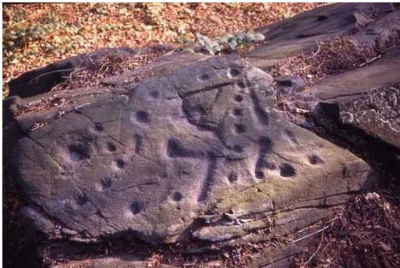
Fig. 5- Vignone - Pressi di Cà di Mïi

Noi dobbiamo cercare di chiarire quale era la cultura, così basilare ed universale da interessare tutto il mondo e così radicata da durare decine di millenni che ha portato a queste incisioni. Di fronte a tale quesito trovo secondario, anche se certamente molto utile, determinare la datazione di ogni singolo reperto.