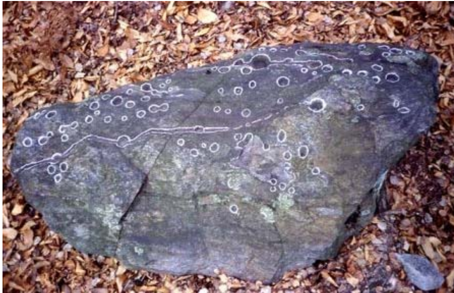
Fig. 3- Oggebbio - Sentiero Luera- Dumera

3)- Il modo più razionale per condurre una ricerca di questo tipo è quello di isolare una porzione di territorio e dentro questa intraprendere una ricerca il più possibile esaustiva, cioè "a tappeto". Così facendo si scopre (questo almeno è quello che mi è accaduto nelle zone che ho indagato) che i siti di cospicue si vanno a collocare nei punti più significativi del territorio stesso. Si tratta di paesi, alpeggi, sentieri, guadi, passi e valichi, incroci di percorsi, posizioni dominanti e comunque nella stragrande maggioranza dei casi luoghi di particolare importanza geografica e-fatto di notevole rilevanza-spessissimo in relazione visiva tra loro.