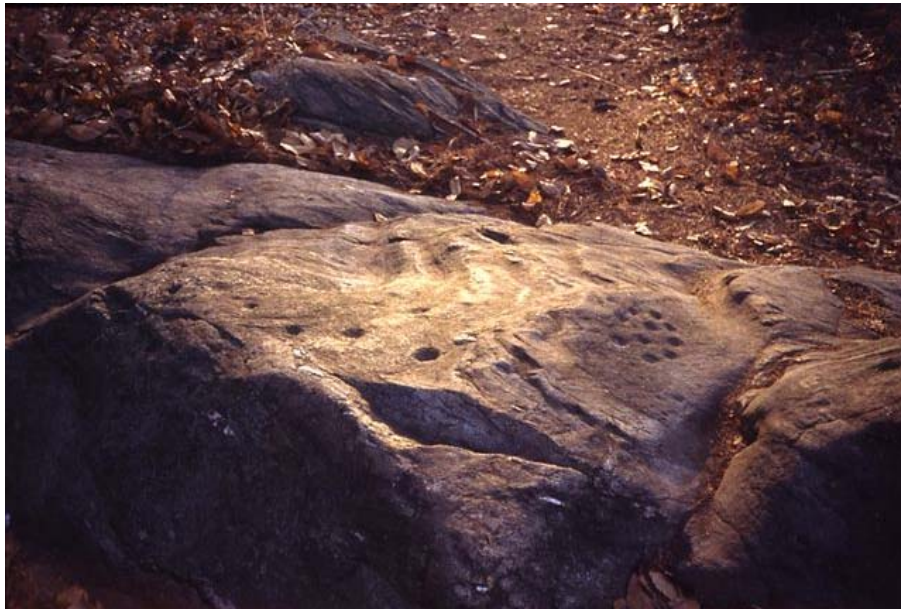
Fig. 2 Bèe - Frazione Roncaccio

Sulla base di queste considerazioni non è un caso che la Val Vigizzo sia stata forse la prima zona della provincia ad evidenziare il fenomeno e, con la Valle Antrona, la più conosciuta. Infatti, a differenza di altre zone dove i massi cuppellati sono del tutto ignorati e persino "invisibili", cioè non notati anche se visti, da parte della popolazione, la Val Vigizzo conserva a livello popolare la conoscenza di questi reperti la cui misteriosità ed incomprensibilità è tale da attribuirne la causa all'evento naturale più eclatante e terrificante: il fulmine. "Sass 'd'la lesna"-sassi del fulmine- è infatti la denominazione dei massi cuppellati, nella mitizzazione che il fulmine abbia inciso per fusione questi buchi emisferici.