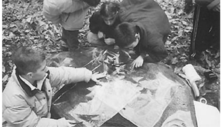
Attività didattica con classi della scuola elementare Baricco di Torino sulle rocce a cospelle di Truc Monsagnasco, (Rivoli)