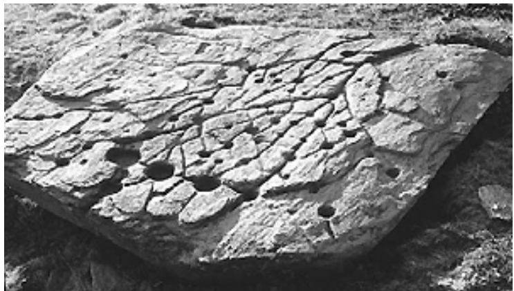
Associazione di coppelle e reticolato complesso di canaletti (Cro da Lairi. Val Chisone. foto A. Arcà)

Dal punto di vista interpretativo emergono alcuni elementi che possono essere considerati indiziari: la presenza preferenziale su superfici o tavole piane (o leggermente inclinate, esemplari i casi della Pera Crevolà - Valsusa e di Cro da Lairi - Val Chisone) e aggettanti, il posizionamento presso luoghi dominanti o comunque panoramici (esemplare il caso di Bric Lombatera in valle Po, sito oltretutto dominato dalla imponente mole del