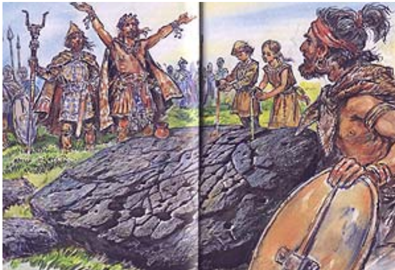
Da "La Figura sulla Roccia" (tavola di Luigi Togliatto Amateis)

Tutti questi elementi vanno con ogni probabilità collegati ad una pratica di tipo rituale, di deposito o di offerta votiva o sacrificale collegata con la gestione o con il possesso del territorio. E' questa un'ipotesi già avanzata da tempo (coppelle definite come "altari sacrificali"), ma che trova oggi una maggiore credibilità in funzione di un possibile collegamento ad un culto delle cime (GAMBARI 1997), intese queste ultime come sede elettiva della divinità.